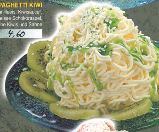
SPAGHETTI KIWI Vanilleeis, Kiwisauce 2 , weiße Schokoraspel, frische Kiwis und Sahne € 4,60