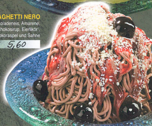
SPAGHETTI NERO Schokoladeneis, Amarene, Schokosirup, Eierlikör 1 , Schokoraspel und Sahne € 5,60