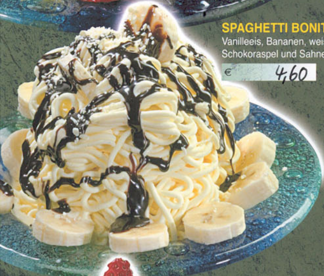
SPAGHETTI BONITO Vanilleeis, Bananen, weisse Schokoraspel und Sahne € 4,60