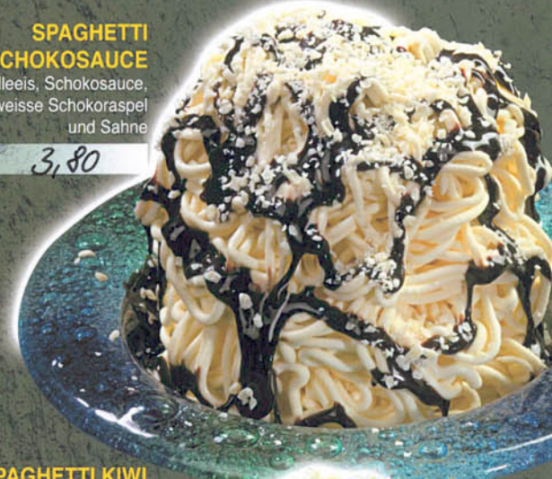
SPAGHETTI SCHOKOSAUCHE Vanilleeis, Schokosauce, weiße Schokoraspel und Sahne € 3,80