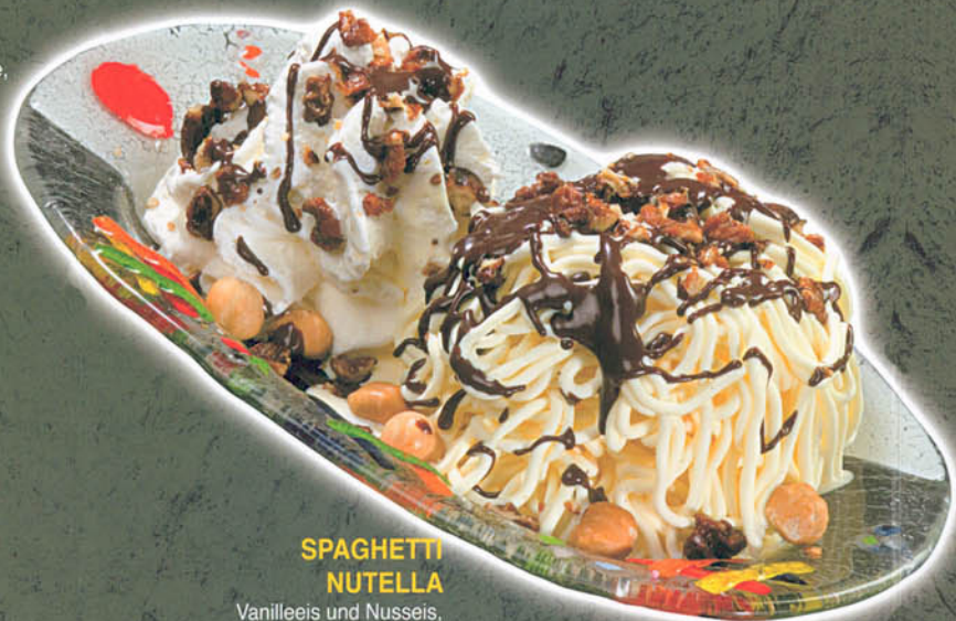
SPAGHETTI NUTELLA Vanilleeis und Nusseis, geröstete Haselnüsse, Krokant, Nutellasauce und Sahne € 4,60