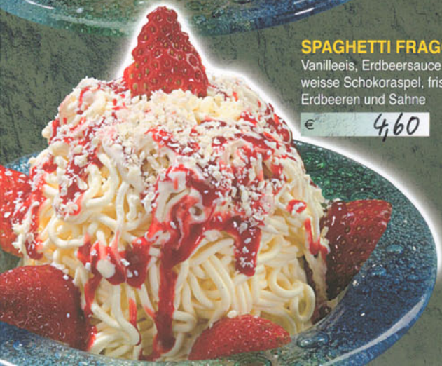
SPAGHETTI FRAGOLE Vanilleeis, Erdbeersauce, weisse Schokoraspel, frische Erdbeeren und Sahne € 4,60