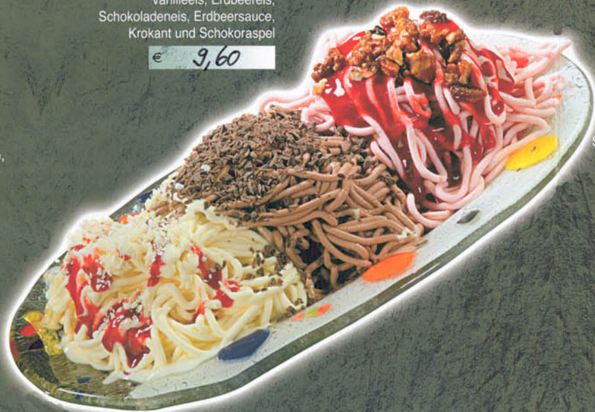
SPAGHETTI COMBINAZIONE Vanilleeis, Erdbeereis, Schokoladeneis, Erdbeersauce, Krokant und Schokoraspel € 9,60