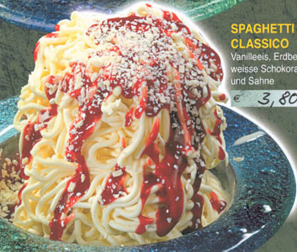
SPAGHETTI CLASSICO Vanilleeis, Erdbeersauce, weiße Schokoraspel und Sahne € 3,80