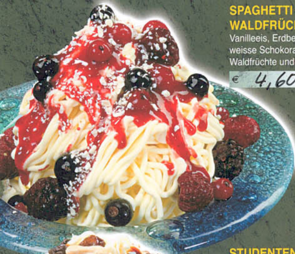
SPAGHETTI WALDFRÜCHTE Vanilleeis, Erdbeersauce, weiße Schokoraspel, Waldfrüchte und Sahne € 4,60