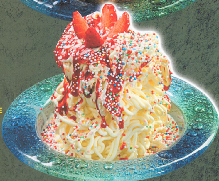
SPAGHETTI BAMBINO Vanilleeis, Erdbeersauce, bunte Streusel und Sahne € 4,60

ELLI ZAMPERON s.a.s. • Tel. 0039_339_1028998 • 0039_049_706020 • Tutti i diritti riservati ©